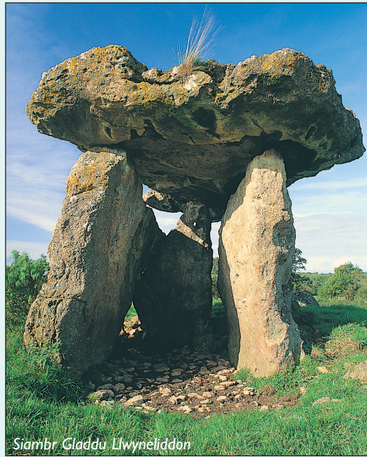
Siambr Gladdu Llwyneliddon