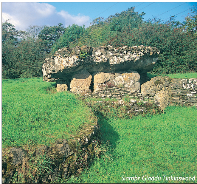
Siambr Gladdu Tinkinswood