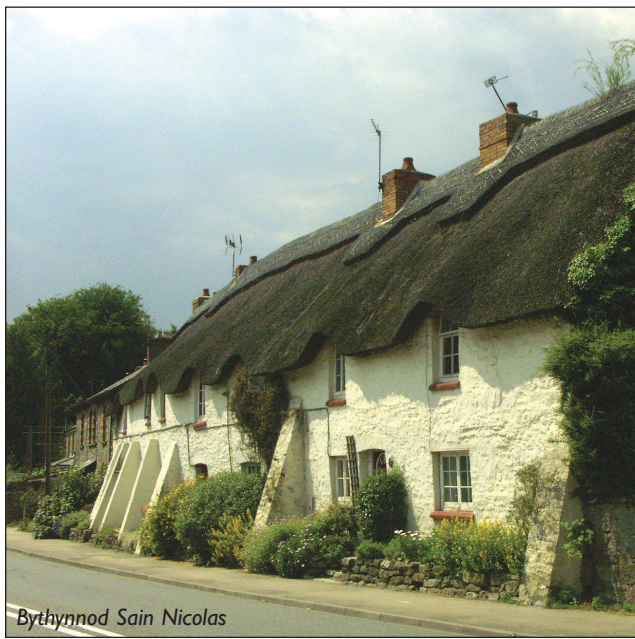
Bythynnod Sain Nicolas