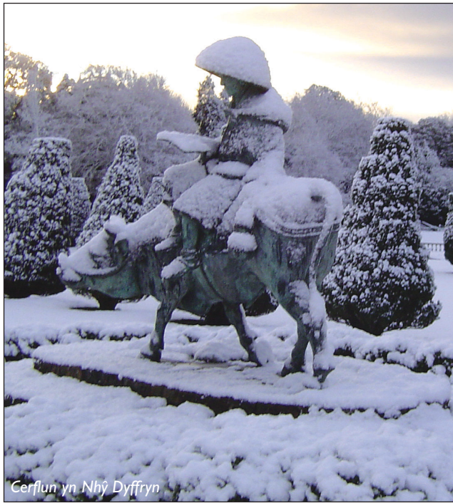
Cerflun yn Nhy Dyffryn