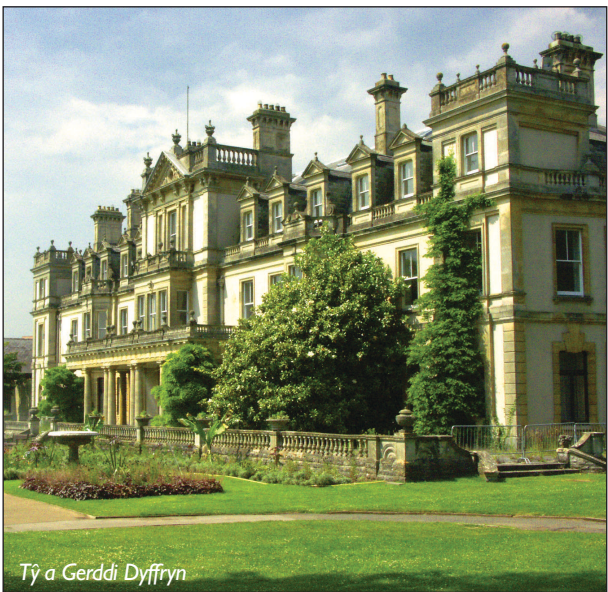
Tŷ a Gerddi Dyffryn