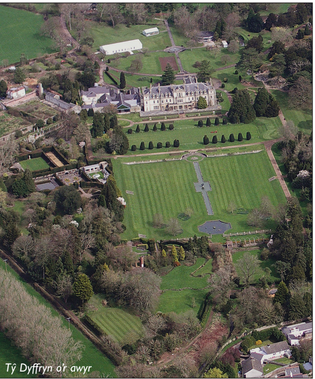
Tŷ Dyffryn o'r awyr