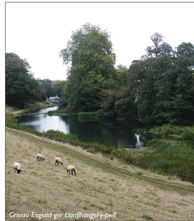
Grisiau Eogiaid ger Llanfihangel-y-pwll

Mae Valeways wedi cyhoeddi teithlyfr Llwybr Treftadaeth y Mileniwm. Mae'r llyfr lliwgar hwn yn disgrifio 16 rhan y daith gerdded ac yn cael ei gyflwyno mewn pecyn sydd hefyd yn cynnwys 16 o fapiau A3 cyfatebol. Cewch ei brynu oddi wrth Valeways am £8.49 sy'n cynnwys cludiant a phacio.