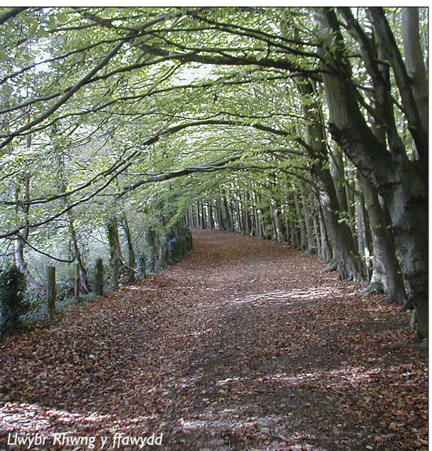
Llwybr Rhwng y ffawydd