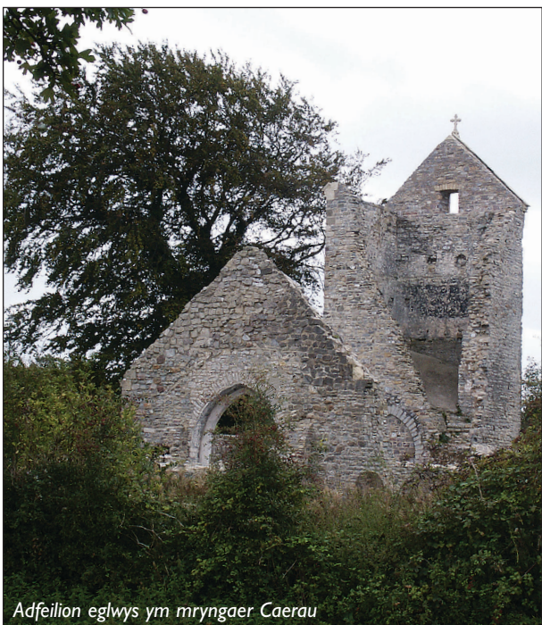
Adfeilion eglwys ym mryngaer Caerau