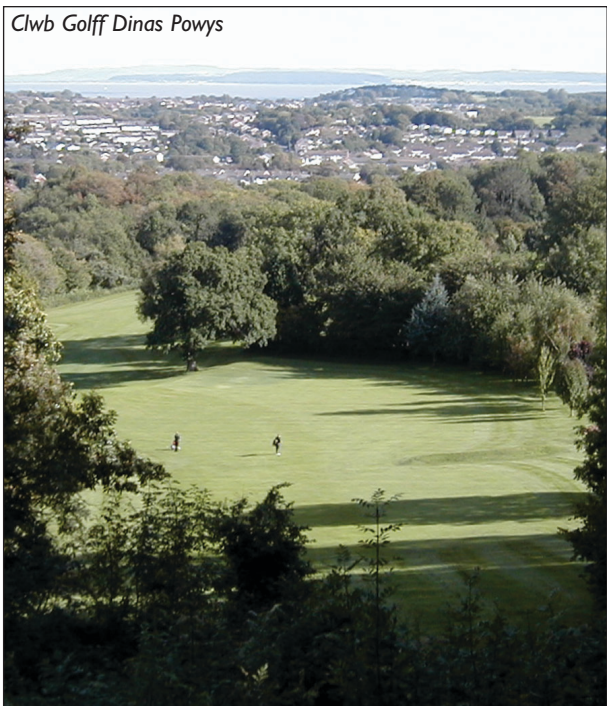
Clwb Golf Dinas Powys